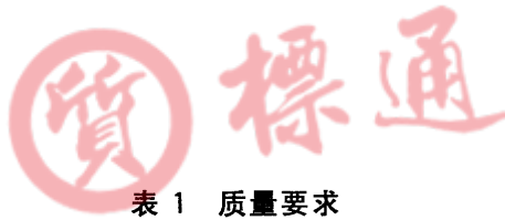
表 1 质量要求